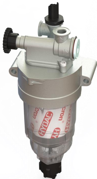
HDP 240 BC - Vorfilter